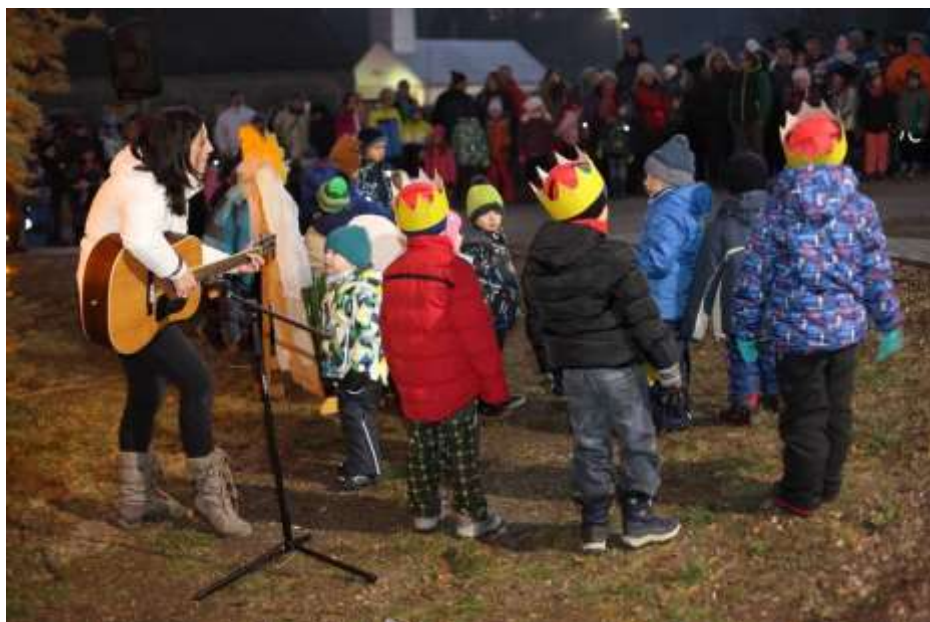
Rychnovské listy: periodický tisk územně samosprávného celku, vychází dle potřeby. Vydává obec Rychnov na Moravě, č.p. 63, 569 34 Rychnov na Moravě